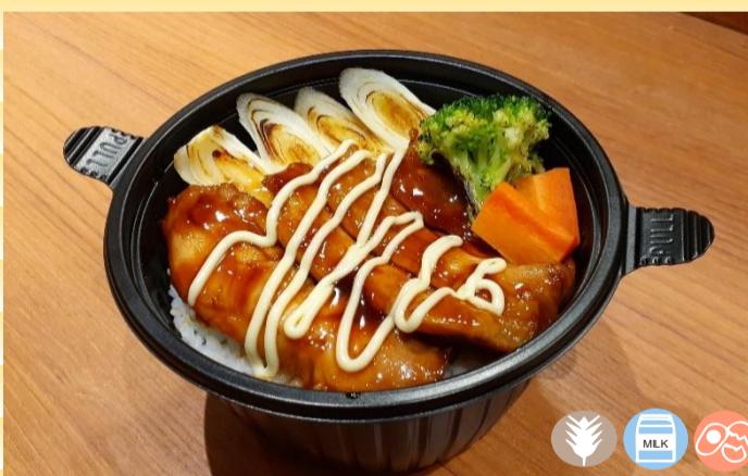
照りマヨチキン丼 700円