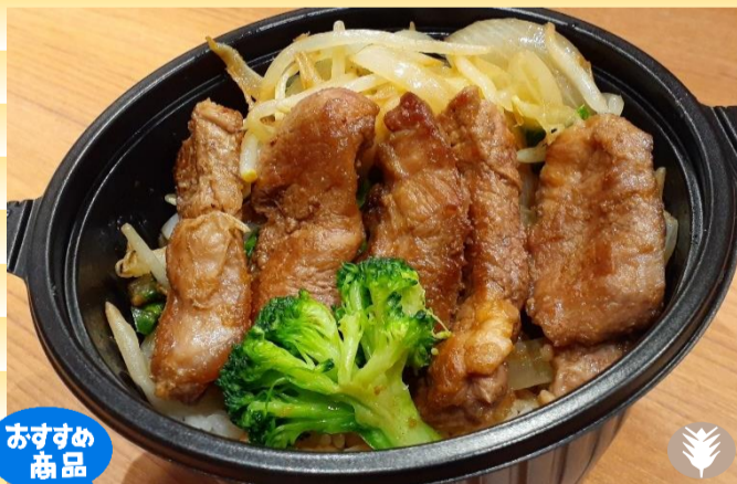
生ラムジンギスカン丼 800円