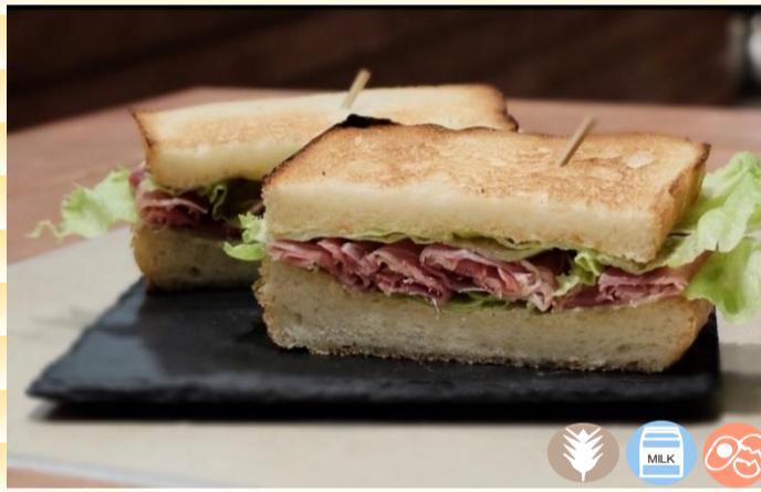
生ハムとクリームチーズ サンドセット 1,400円