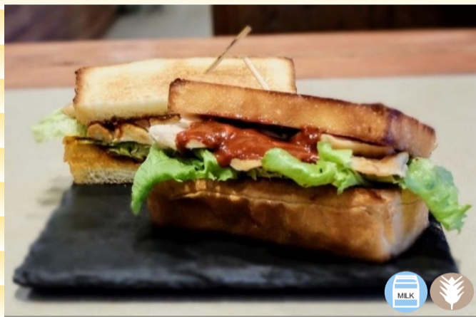
スパイシーチキン サンドセット 1,200円