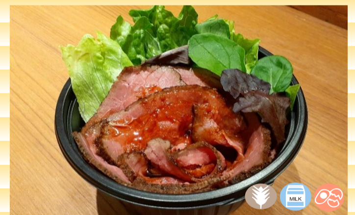
道産牛のローストビーフ丼 1,200円